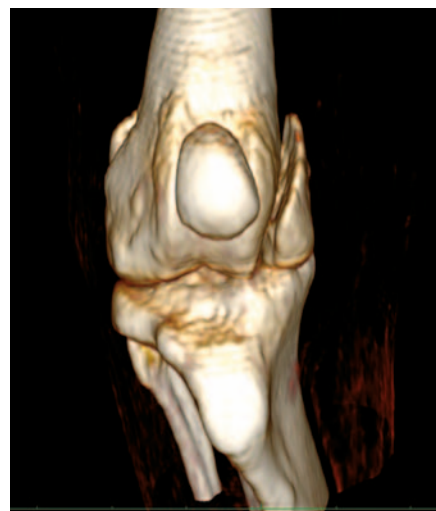
L'orthopédie nous révélera l'intérêt de l'imagerie 3D.

→ par son représentant au sein du conseil scientifique, le groupe de management s'est engagé pour vous apporter le plus de renseignements pratiques pour une application immédiate, raisonnée et profitable dans votre